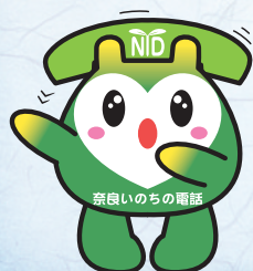
協会マスコットキャラクター ならりん