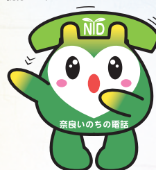
協会マスコットキャラクター ならりん

受講資格 21歳以上73歳未満で、当協会相談ボランティアとして奉仕する志を持つ方